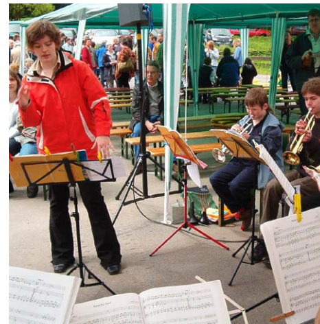
2005 beim Hesselntag im Freizeitheim in Hessel

S.R.: Ich sag mal: solide und spielfähig. Es gab mehr Unterstimmen (Posaunen und Tuben) als hohe Stimmen (Trompeten und Flügelhörner) und wenig junge Mitspieler. Darum starteten wir eine regelmäßige Akquise und warben an der Sudbrack- und Eichendorffschule um Nachwuchs. Es gibt immer noch aktive Bläser bei uns im Chor, die 2001 durch diese Anwerbung angefangen haben. Heute ist die Jungbläserausbildung ein Selbstläufer, und es kommen immer mehr Interessenten hinzu, sogar ganze Familien.